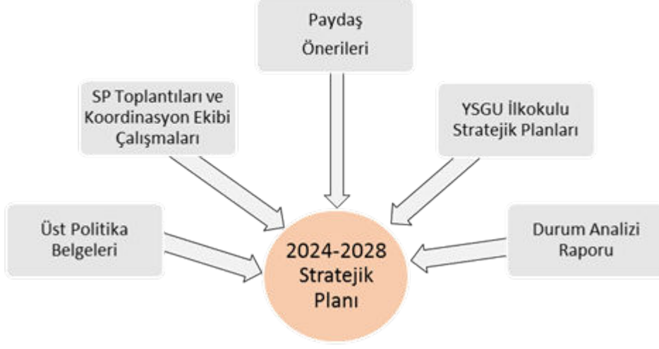
Şekil 1. Somuncubaba İmam Hatip Ortaokulu Stratejik Planlama Süreci